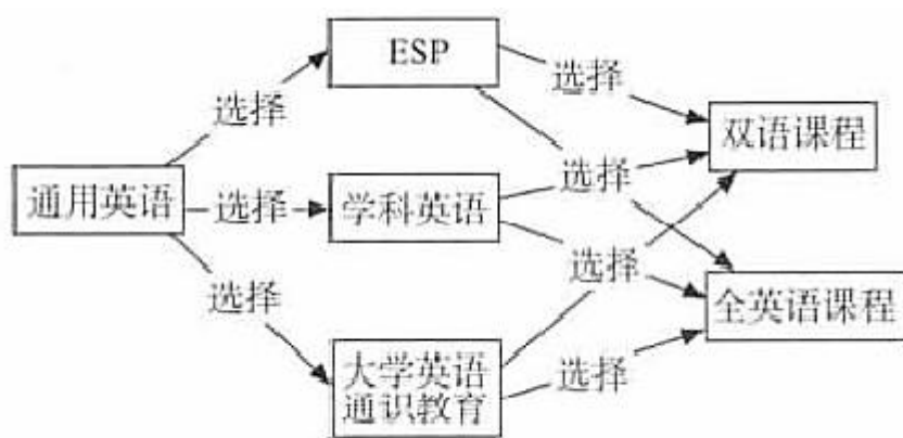
图 1 大学英语学习阶段结构图

根据教育部教育司《大学英语课程教学要求》（2007），在课程设置方面，要求各高校根据实际情况，按照《课程要求》和各校大学英语教学目标设计各自的大学英语课程体系。2010年5月，“大学英语信息化教学改革成果总结暨外语通识教育与课程设置高层论坛”在中山大学举行，会议提出“大学英语后续课程应该以培养学生的人文素养为主，加大通识课程建设”（王哲，李军军 2010）。随后，王守仁（2010，2011，2016）、蔡基刚（2010，2013，2016，2018）、陈坚林（2011，2016）、殷和素等（2011）、马武林（2013，2014）等分别就大学英语后续课程开设的内容提出各自的观点。将上述学者的观点概括起来，非英语专业大学生英语学习可分为三个阶段，即通用英语阶段、桥梁课程阶段（专门用途英语 ESP/学科英语或大学英语通识教育课程）和全英语/双语专业课程阶段（图 1）。大学英语后续课程实际上是指第二个阶段的课程，是保证大学英语学习四年不断线、提高学生综合英语综合应用能力的重要渠道。